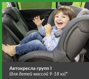
Автокресла групп I (для детей массой 9–18 кг)*